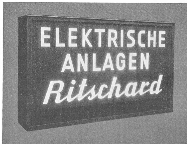
Fig. 6. — Transparent à double face éclairante, équipé avec une seule lampe à vapeur de sodium (Na300U).

Légende : Spiegel = miroir. — Blende = écran. Leuchtfäche = face éclairante.