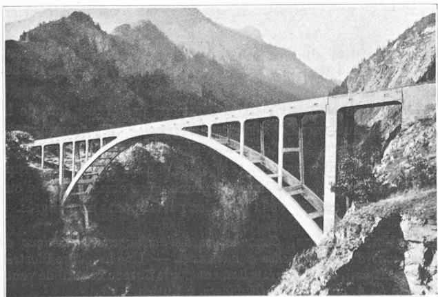
Fig. 2. — Le pont de Gueuroz.