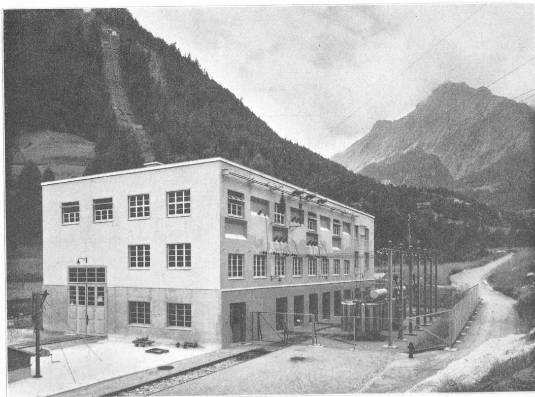
Fig. 39. — Disposition des transformateurs.

ment l'installation électrique en réduisant l'appareillage à la tension des alternateurs à sa plus simple expression. On a cherché à réaliser une liaison directe, alternateur-transformateur, sans l'interposition d'aucun disjoncteur, de manière à créer, en quelque sorte, une unité génératrice à la tension de départ, 50 kV ; cette disposition ressort du schéma général unifilaire fig. 38. Pour les besoins de l'usine (alimentation des services auxiliaires), de même que pour l'alimentation du réseau local de la commune d'Orsières à 10 kV (obligation résultant de la