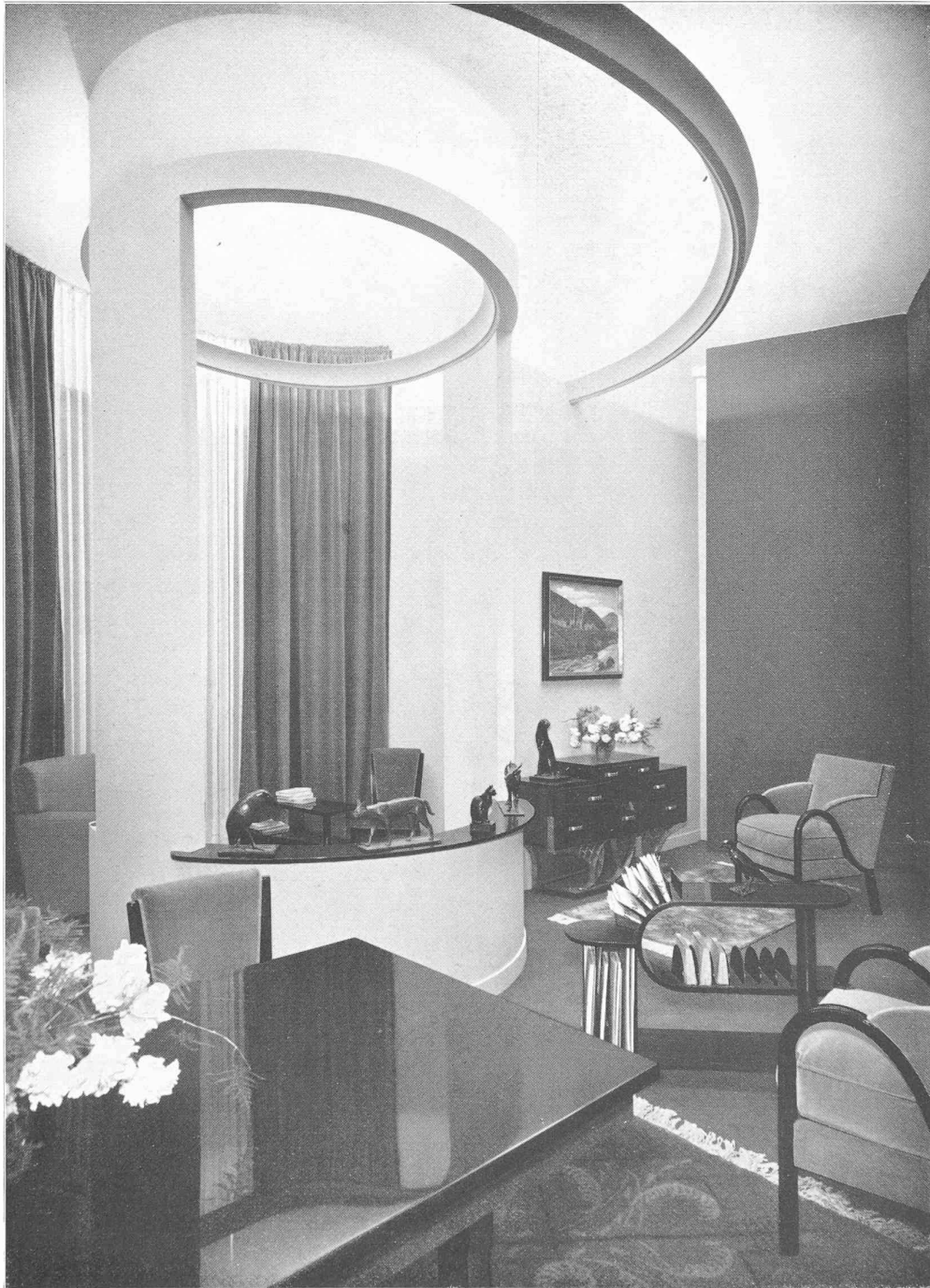
Fig. 1. — Partie de living-room éclairée par deux corniches circulaires.

Table à manger, laque noire et cuivre décoré. Bahut à tiroirs, en palissandre, soubassement en cuivre décoré. Table liseuse en palissandre et cuivre décoré. Fauteuils et chaises en laque noire.