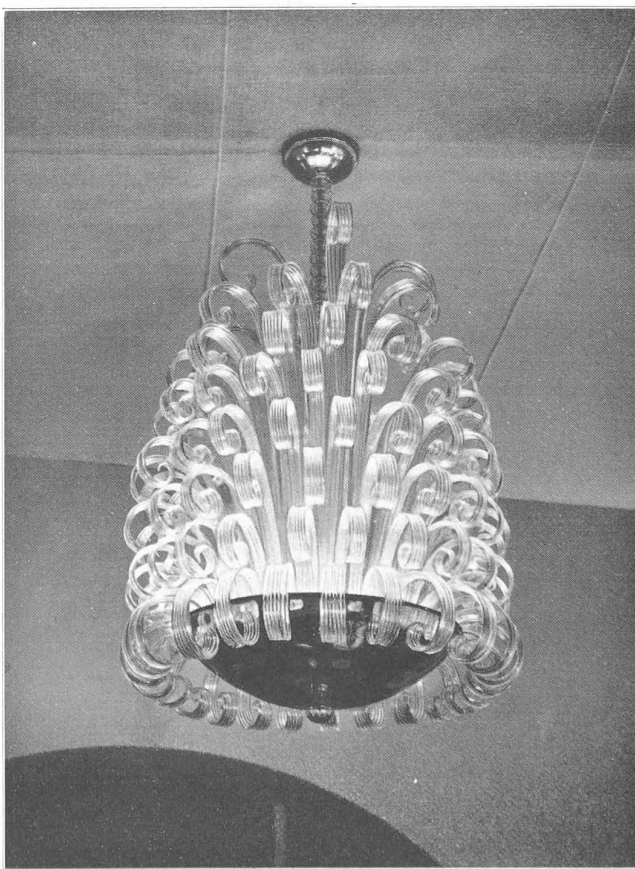
Fig. 2. — Lustre moderne produisant un éclairage presque totalement indirect.