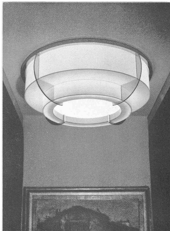
Fig. 3. — Plafonnier en verre émaillé coloré.