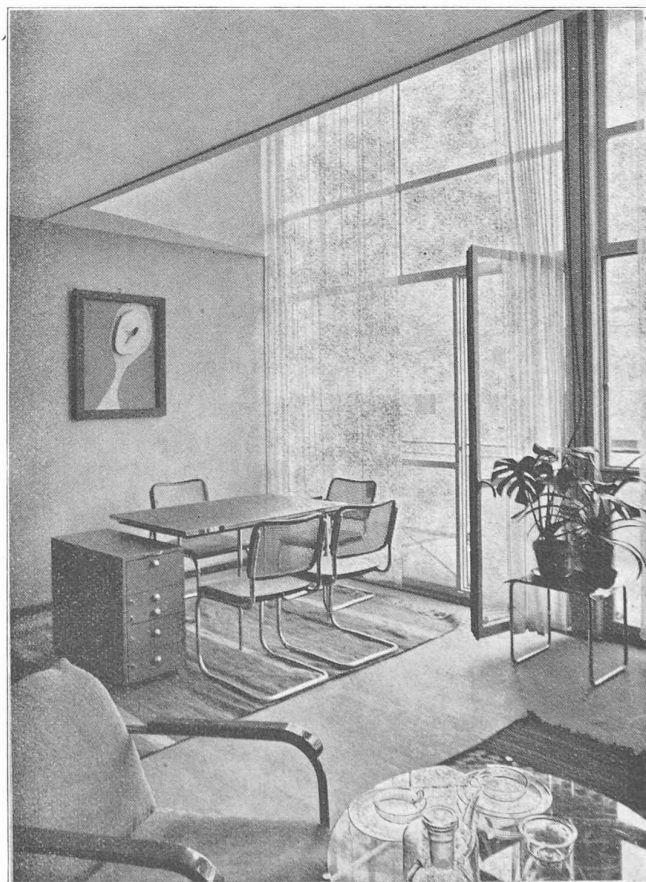
Studio dans la maison de verre, de Le Corbusier , à Genève.

Dès que nous pénétrâmes dans le second bâtiment, au