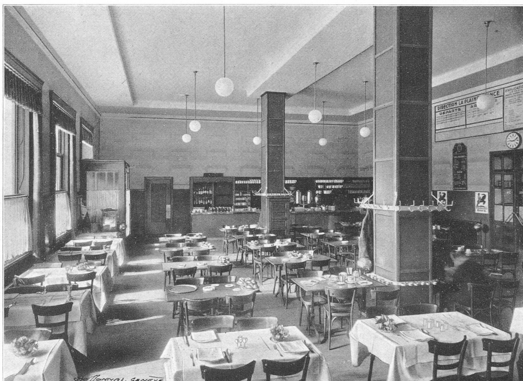
Buffet de III m e classe.