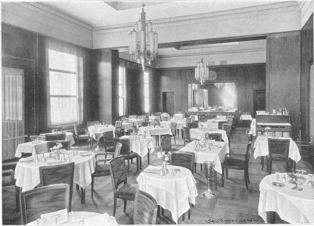
Buffet de 1 re classe.