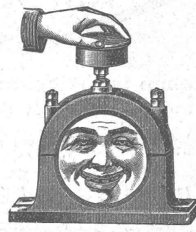
Palier refroidi pendant la marche au moyen de graisse ou de l'huile réfrigérante Brun.