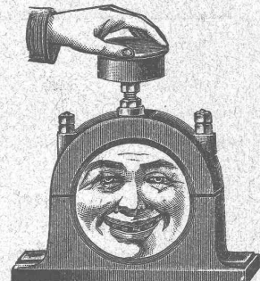
Palier refroidi pendant la marche au moyen de graisse ou de l'huile réfrigérante Brun.