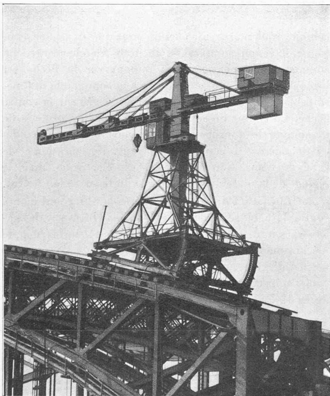
Fig. 2. — Grue à plateforme réglable pour le montage des ponts métalliques.

Le poids de la grue est de 55 t. environ, auquel il faut ajouter environ 12 t. pour le contrepoids. Charge sur chaque galet de roulement sur rail pour la charge normale de la grue : 28 t. La stabilité a été l'objet de soins