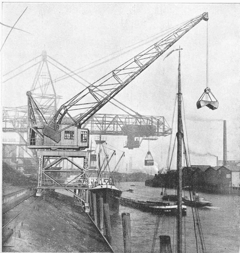
Fig. 2. — Grue de quai, à volée inclinable, dans sa position de portée maximum : 20 m.