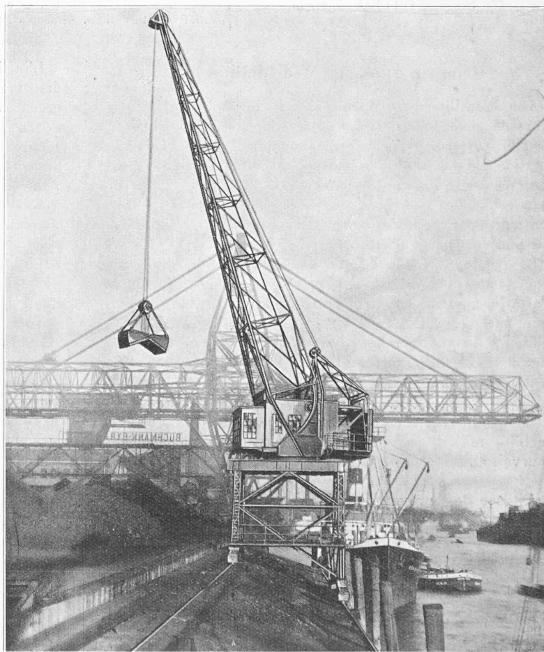
Fig. 3. — Grue de quai, à volée inclinable, dans sa position de portée minimum : 8 m.

Dériaz est aussi connu par de nombreuses constructions industrielles, auxquelles il sut toujours donner un caractère d'unité architecturale, tout en tenant compte avec habileté des nécessités d'exploitation. Citons, entre autres bâtiments à Genève, la Fabrique de remontoirs