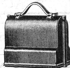
Niveau emballé, 1/6 grandeur naturelle