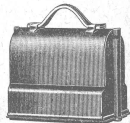
Niveau emballé, 1/6 grandeur naturelle

S. A. de Vente H. Wild - Heerbrugg Téléphone 95 (St-Gall)