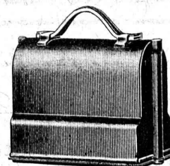
Niveau emballé, 1/6 grandeur naturelle

S. A. de Vente H. Wild - Heerbrugg Téléphone 95 (St-Gall)