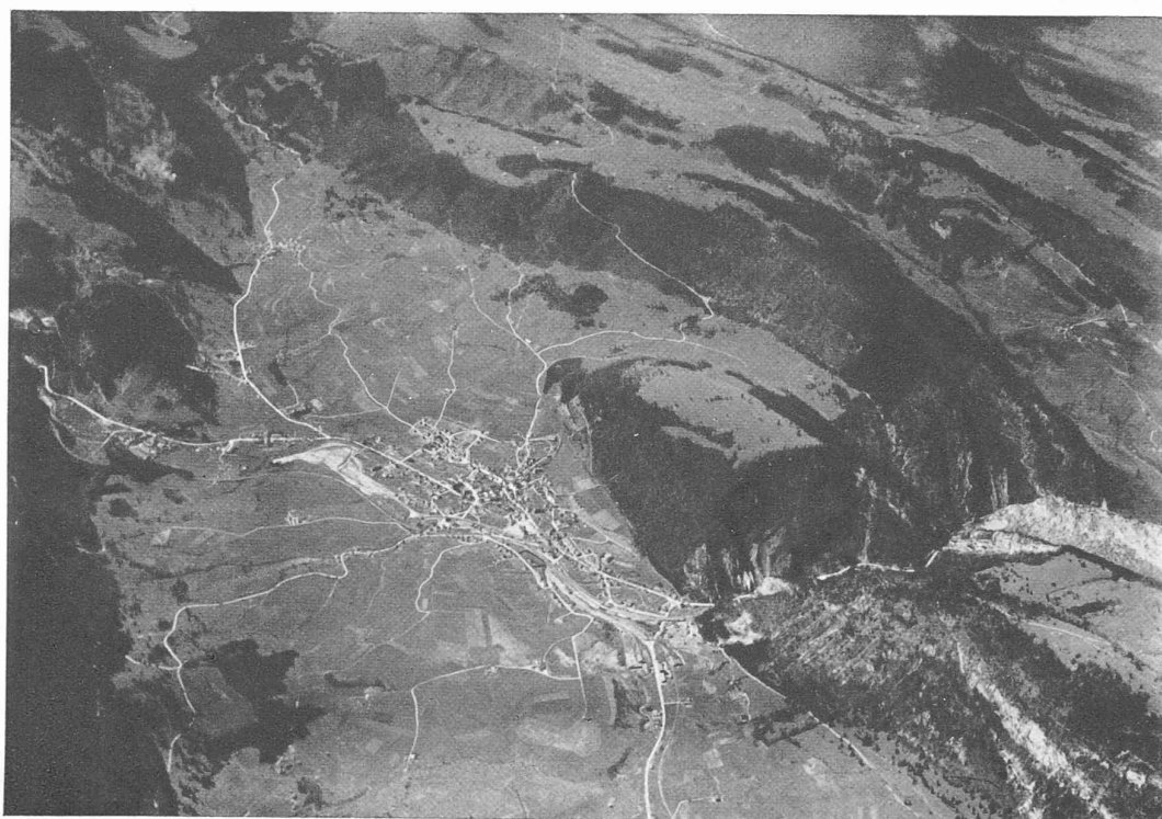
Le village de Moutier sur la Birse et la « Cluse » à travers un pli de la chaîne du Raimeux.