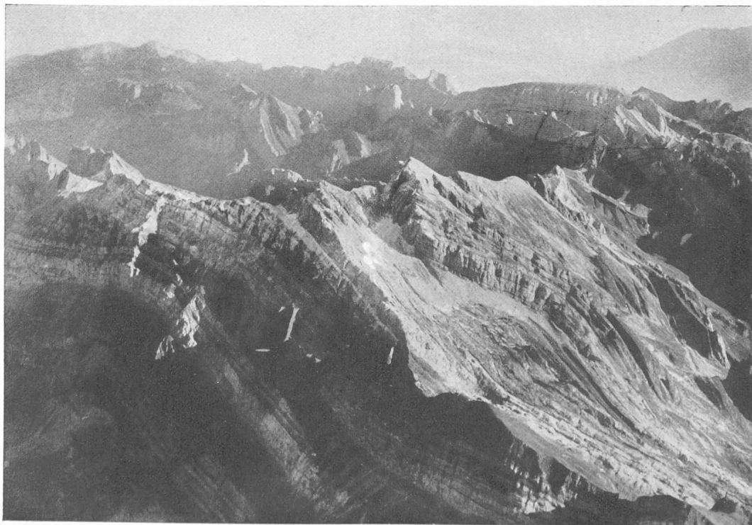
Sântis. Vue, prise de l'ouest, du plissement des couches. A droite, l'Altmann ; à gauche, dans le lointain, le Kasten.