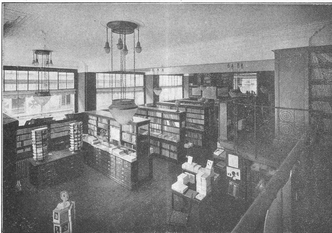
Rez-de-chaussée de la librairie Payot, à Lausanne.

mécanique rationnelle, a pu être mis au point avec certitude et sans délai ».