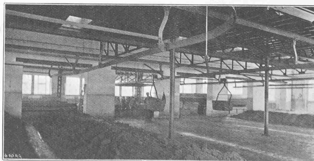
Fig. 63. — Epurateurs. — Manutention de la masse

Lorsqu'il s'agit de changer un épurateur, la circulation du gaz y est interrompue, puis au moyen d'un pont rou-