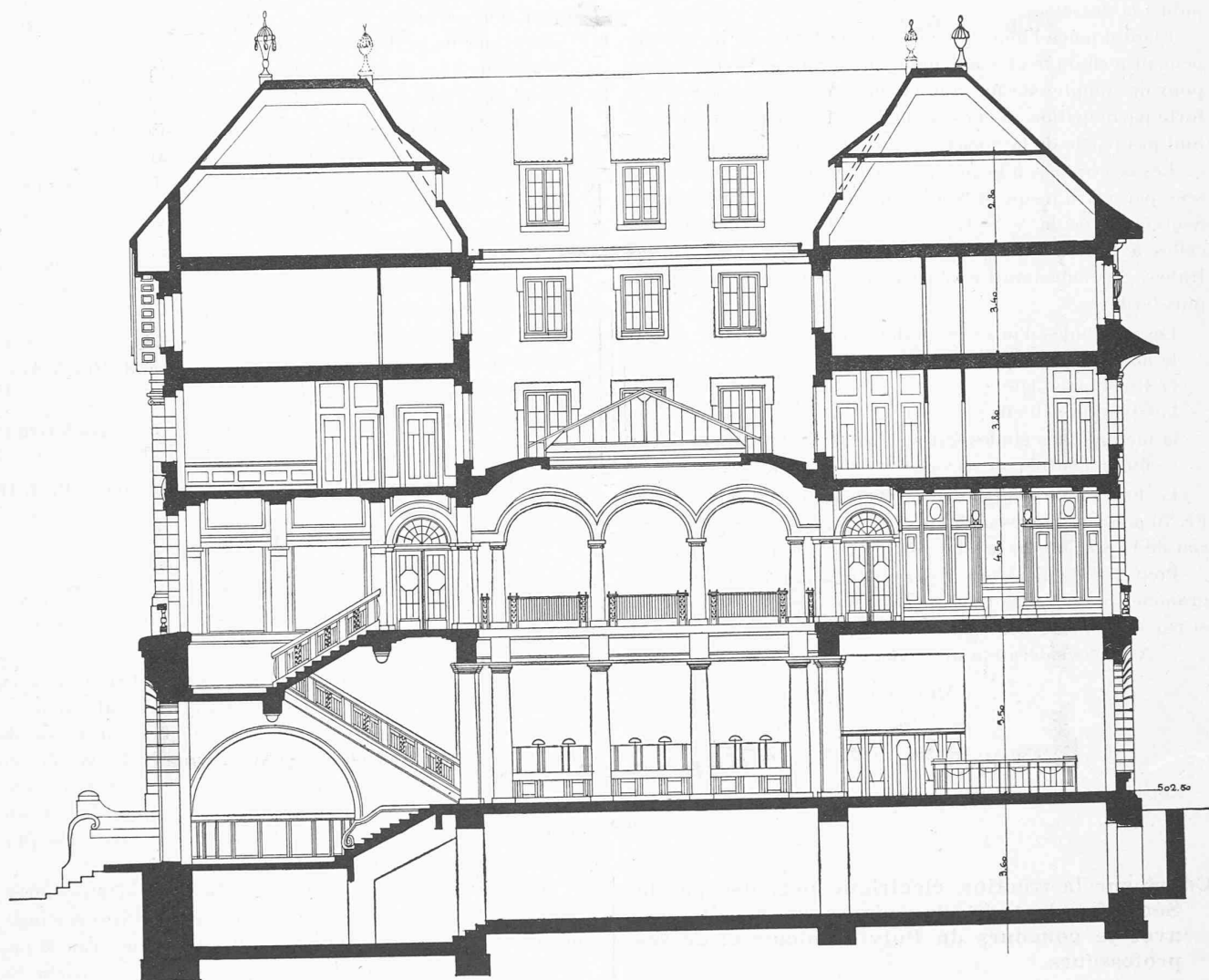
Coupe transversale. — 1 : 200.

le juge à propos, présenter une étude d'adaptation de ces projets à d'autres des emplacements désignés. Cette étude pourra être à l'échelle de 1 : 200.