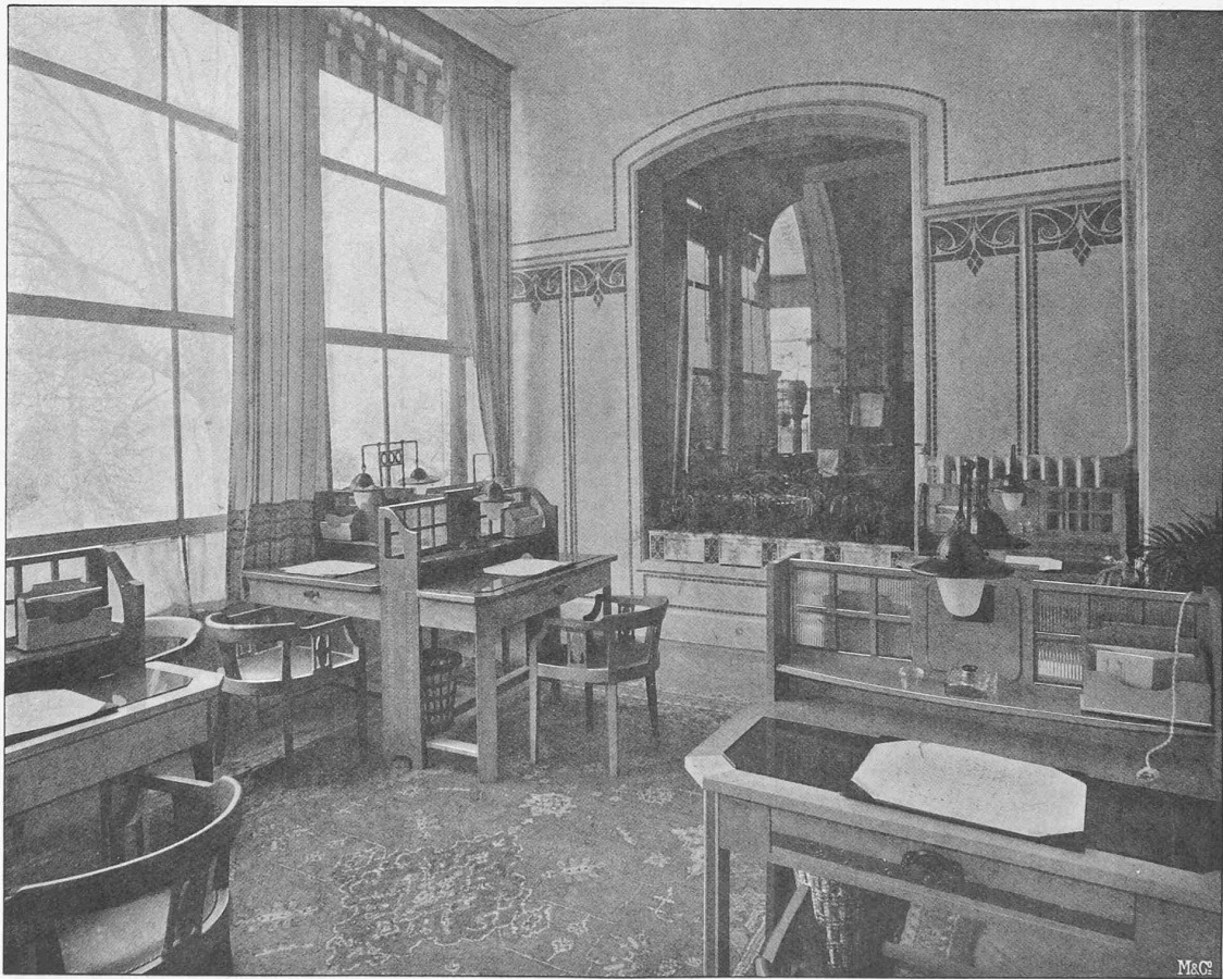
Fig. 2. — Salle de correspondance, Architectes : MM. Mauerhofer, van Dorsser et Bonjour, à Lausanne. Ameublement de la maison A. Ballié, à Bâle.

Le jury pourra néanmoins statuer sur les projets arrivés en retard mais dûment consignés à la poste en temps utile.