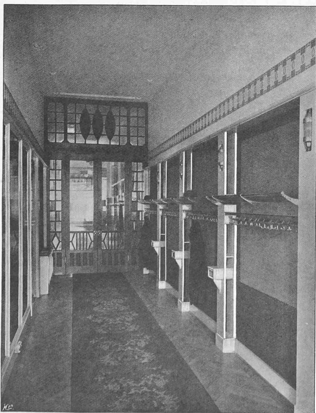
Fig. 4. — Vestiaire.

Architectes : MM. Maurhofer, van Dorsser et Bonjour, à Lausanne. Ameublement de la maison A. Ballié, à Bâle.