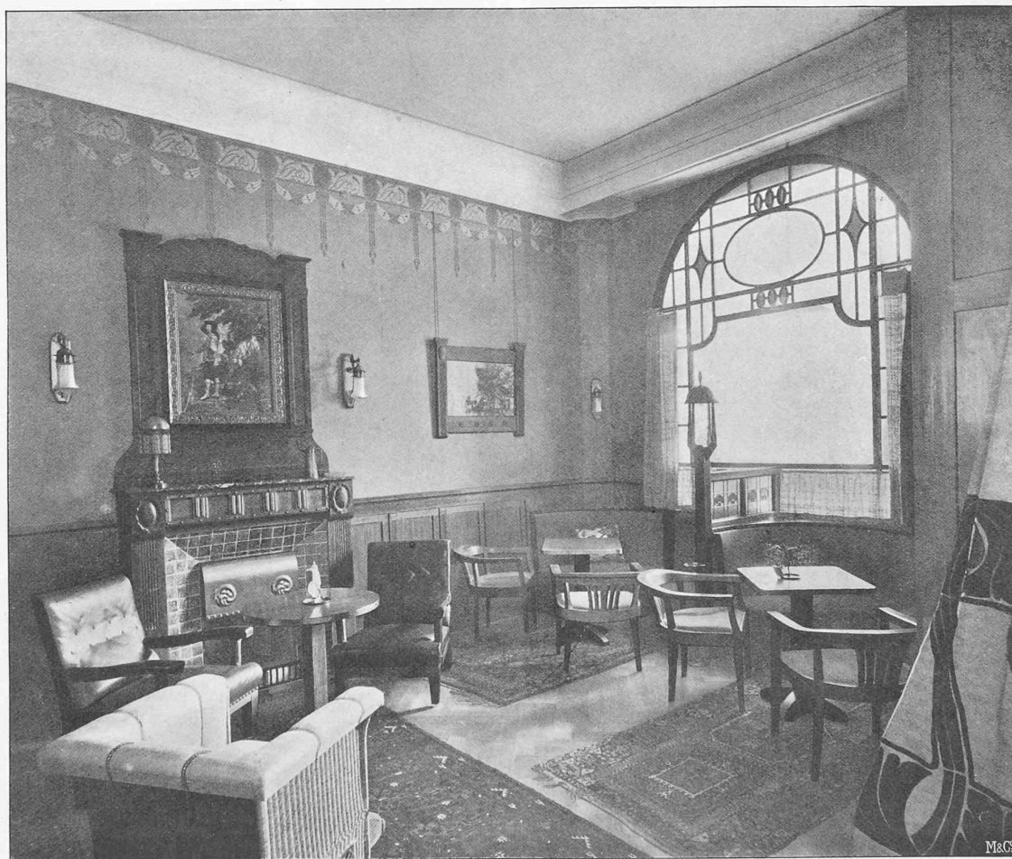
Fig. 1. — Fumoir.

Architectes : MM. Mauerhofer, van Dorsser et Bonjour, à Lausanne.