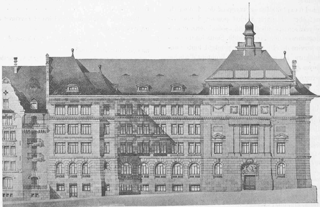
Façade sur la rue Voltaire.

Art. 11. Ciment. Il ne faut employer que du ciment Portland à prise lente, conforme aux normes suisses.