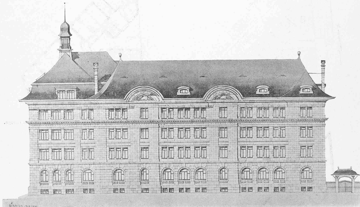
Façade sur le chemin des Petits Délices.

V e prix : Projet « Lycée », de MM. Maurette et Henchoz, architectes, à Genève.