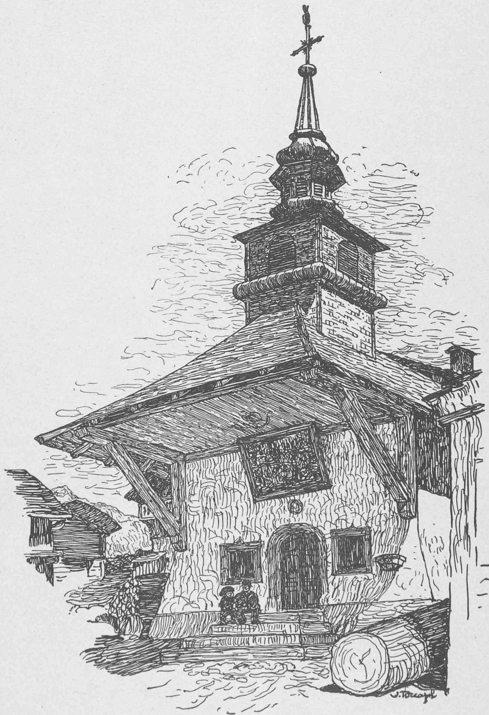
Salvagny (Vallée de Sixt).