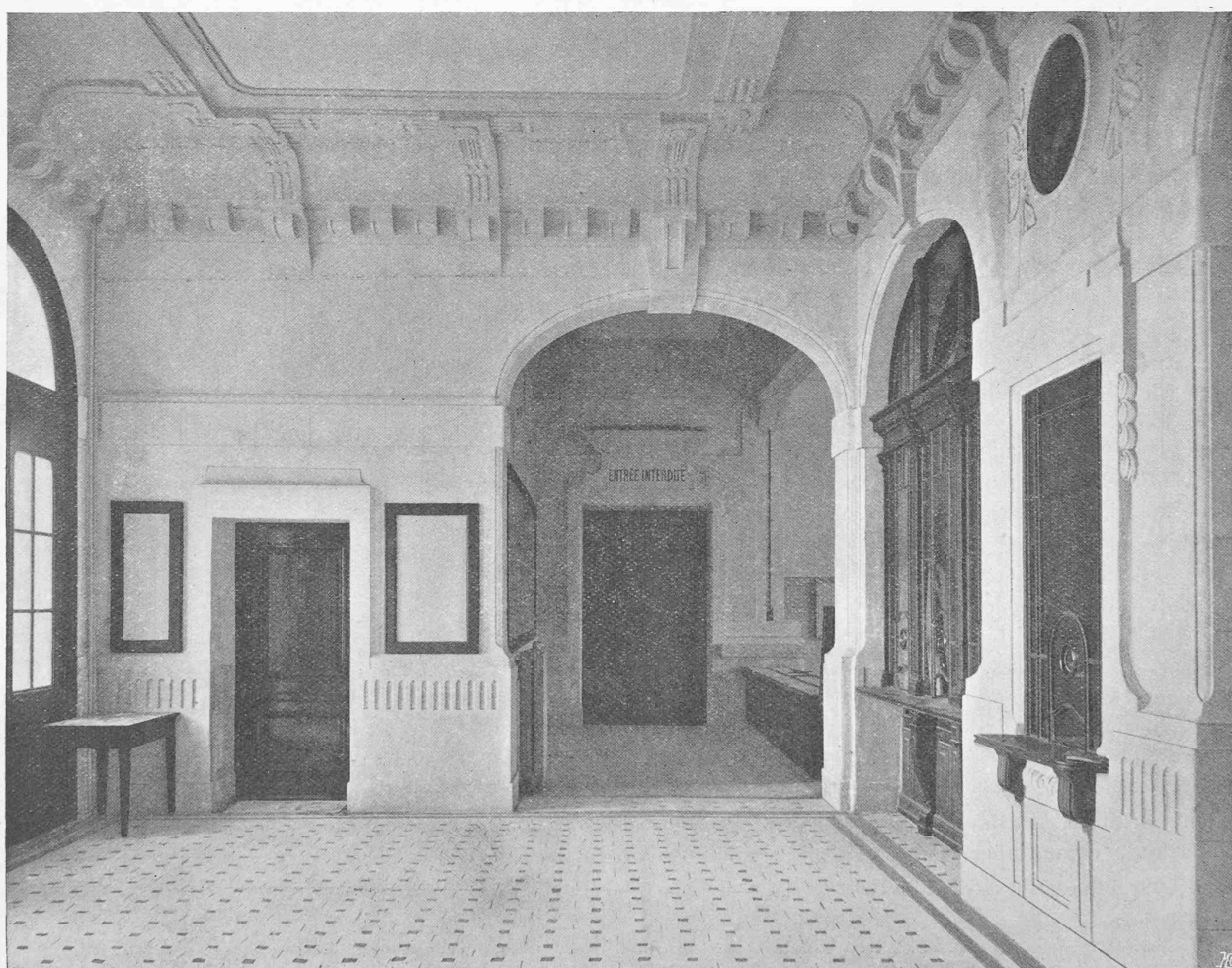
Vue du vestibule.

La nouvelle gare de Renens. — Architectes : MM. Taillens & Dubois, à Lausanne.