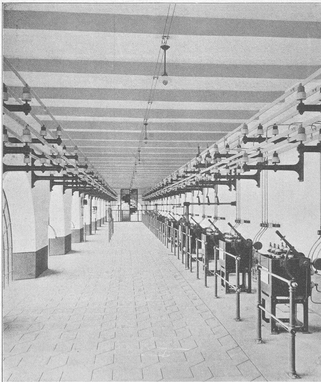
Fig. 23. — Salle des connexions.

Fournisseurs. — Les turbines ont été fournies par la maison Piccard, Pictet & Cie, à Genève. Les alternateurs,