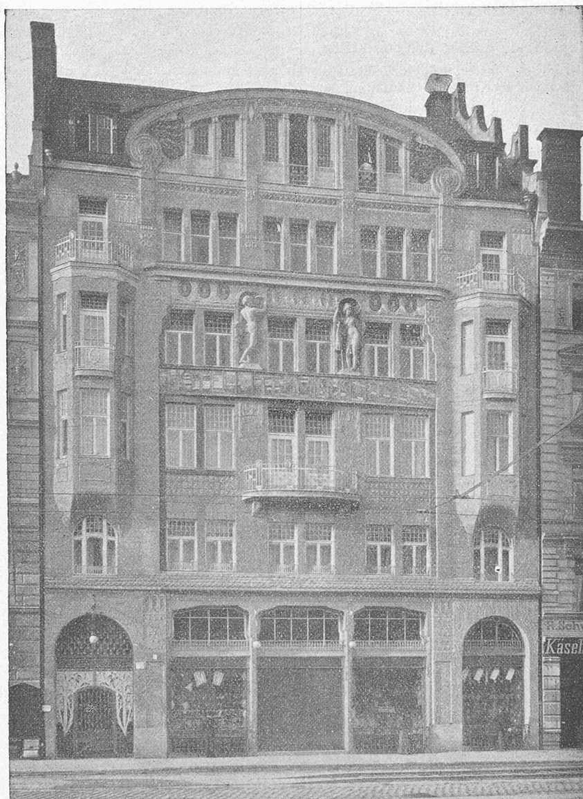
Fig. 18. — Façade de la maison N° 43 de la Bayerstrasse, à Munich.