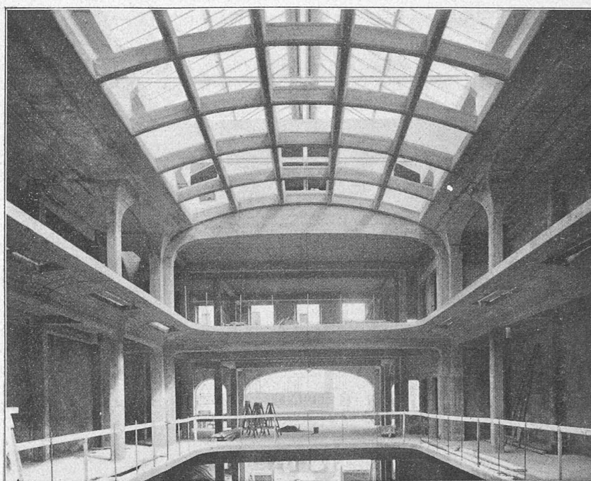
Hall des magasins Badan & Cie, à Genève. — Vue de la partie antérieure.

Le pont comprend six travées de 28 m ,75 d'ouverture. Il est formé de deux séries de voûtes parallèles en béton armé sys-