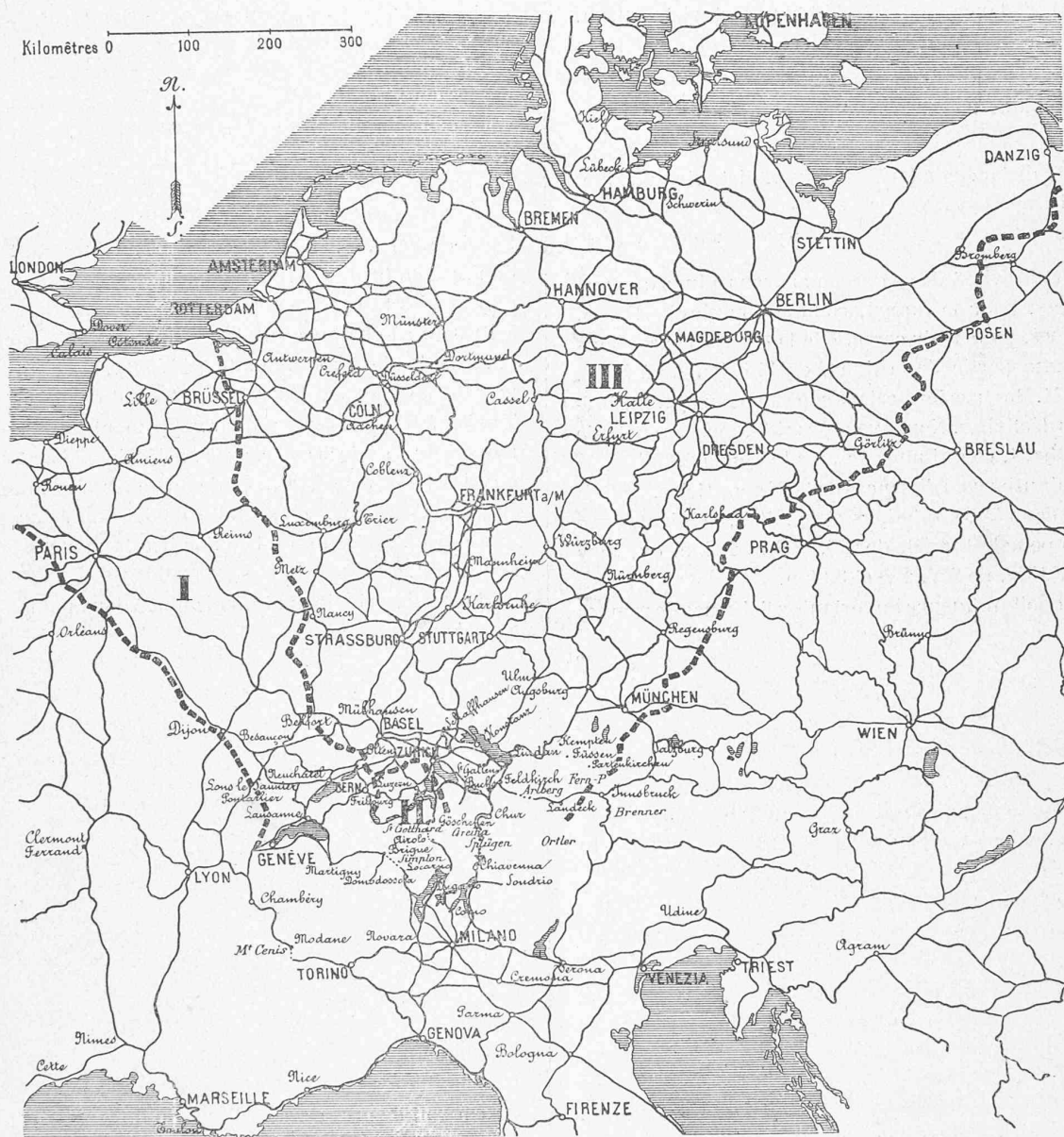
FIG. 2. — CARTE DES ZONES DE TRAFIC DES LIGNES DE CHEMINS DE FER CONSTRUITES OU PROJETÉES A TRAVERS LES ALPES SUISSES

Le trafic italien étant supposé concentré en un point situé près de Cremona.