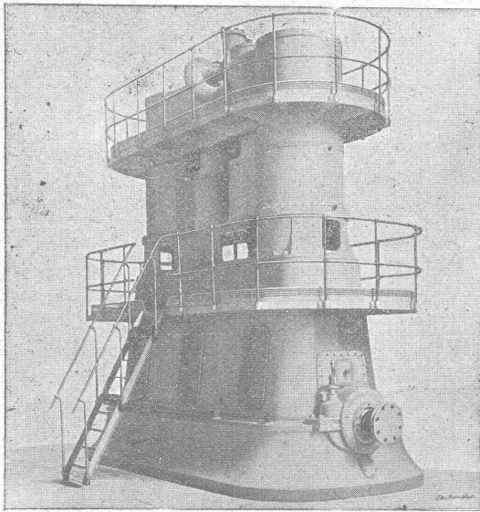
Machine à triple expansion ayant fonctionné à l'Exposition de 1900. (Galerie des Groupes électrogènes).

Puissance : 1200 chevaux env. - Nombre de tours par minute : 250.