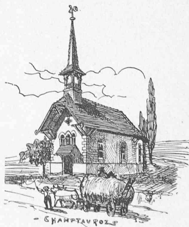
— CHARENTAUX —

Par contre, si la restauration est laissée aux soins du maçon, celui-ci supprimera tout bois inutile selon son idéal, qui sera de voir un clocher en maçonnerie, avec chaînes d'angle en ciment appliqué, corniche en ciment et, entre quatre pyramidions toujours en ciment, une flèche plutôt semblable à une aiguille s'élever chétive et