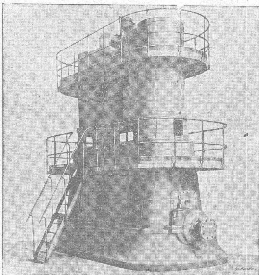
Machine à triple expansion ayant fonctionné à l'Exposition de 1900.