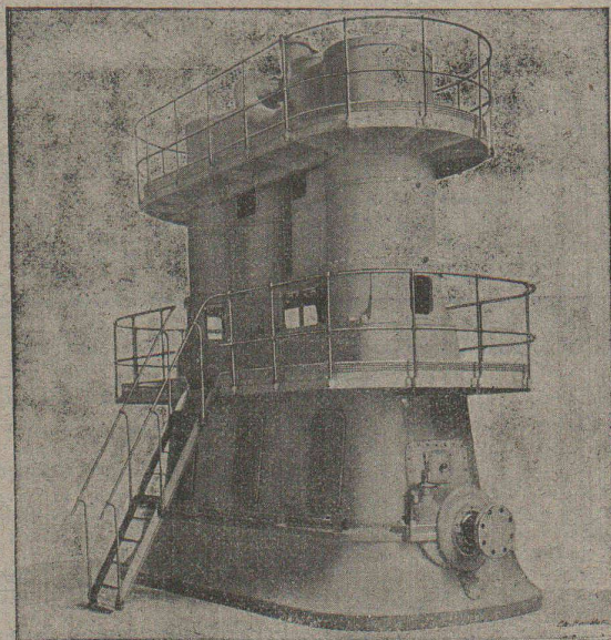
Machine à triple expansion ayant été installée à l'Exposition de 1900

BREVET D'INVENTION S. G. D. G. DU 14 JANVIER 1897