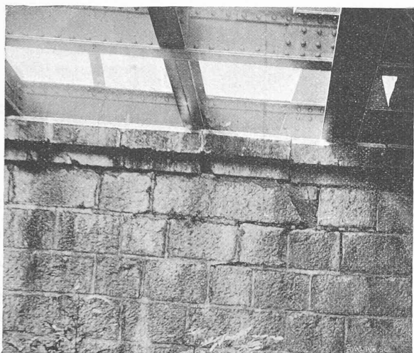
Fig. 28. — Arnon.

les avaries de ce genre sont encore plus fréquentes, parce que les poutres se tordent un peu dans tous les sens et que l'appareil des pierres est le plus souvent moins soigné lorsqu'il est plus compliqué. Quand l'appui est placé au sommet d'un