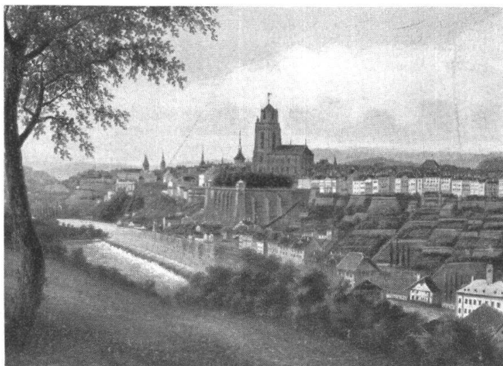
Ansicht der Südostseite der Stadt Bern von ca. 1840

Die zwei vom Grafen de Souancé der Stadt Bern geschenkten Oelgemälde.