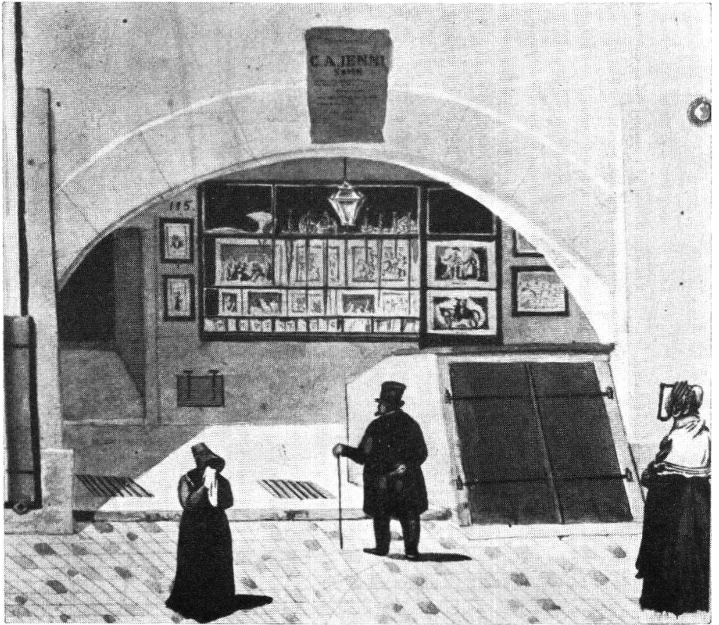
Laterne in der Laube des Hauses Nr. 61 (früher 115) der Gerechtigkeitsgasse