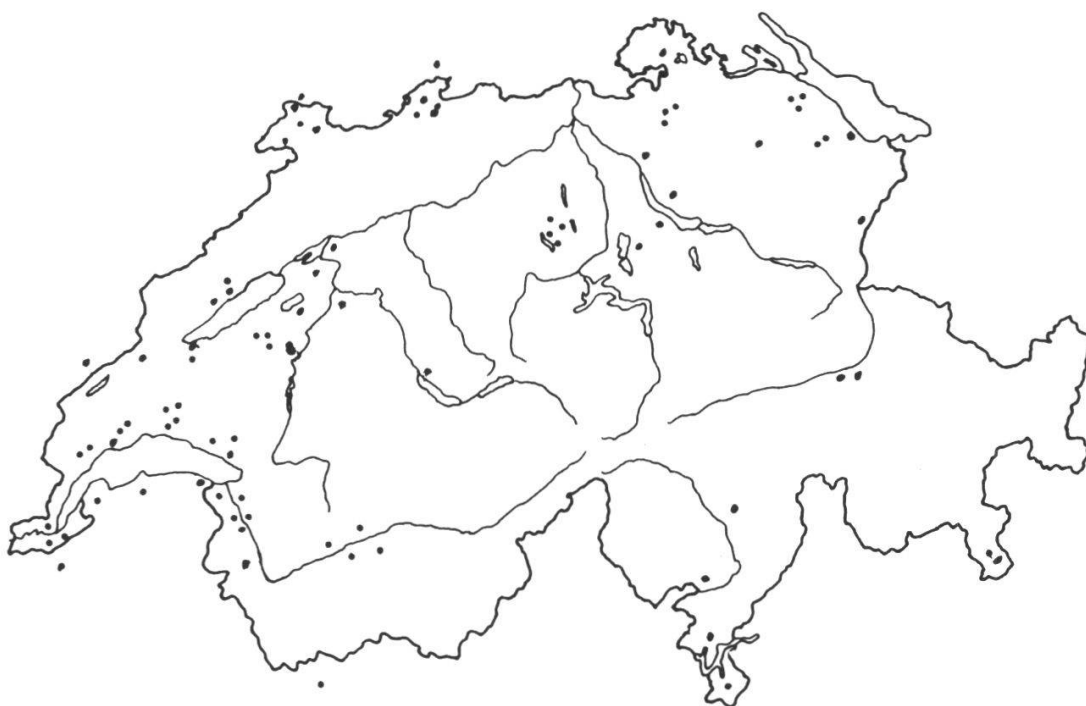
Figure 2. – Provenance des variétés recensées et greffées.

De nombreuses variétés sont d'origine suisse allemande: pour les pommes on doit citer les cantons de Thurgovie, Zurich, Berne et Argovie, les mêmes pour les poires avec Lucerne, les régions de Bâle, du Seeland, du lac des Quatre-Cantons et le bassin lémanique pour les cerises, le Jura, le pourtour du lac de Neuchâtel, le canton de Zurich pour les prunes.