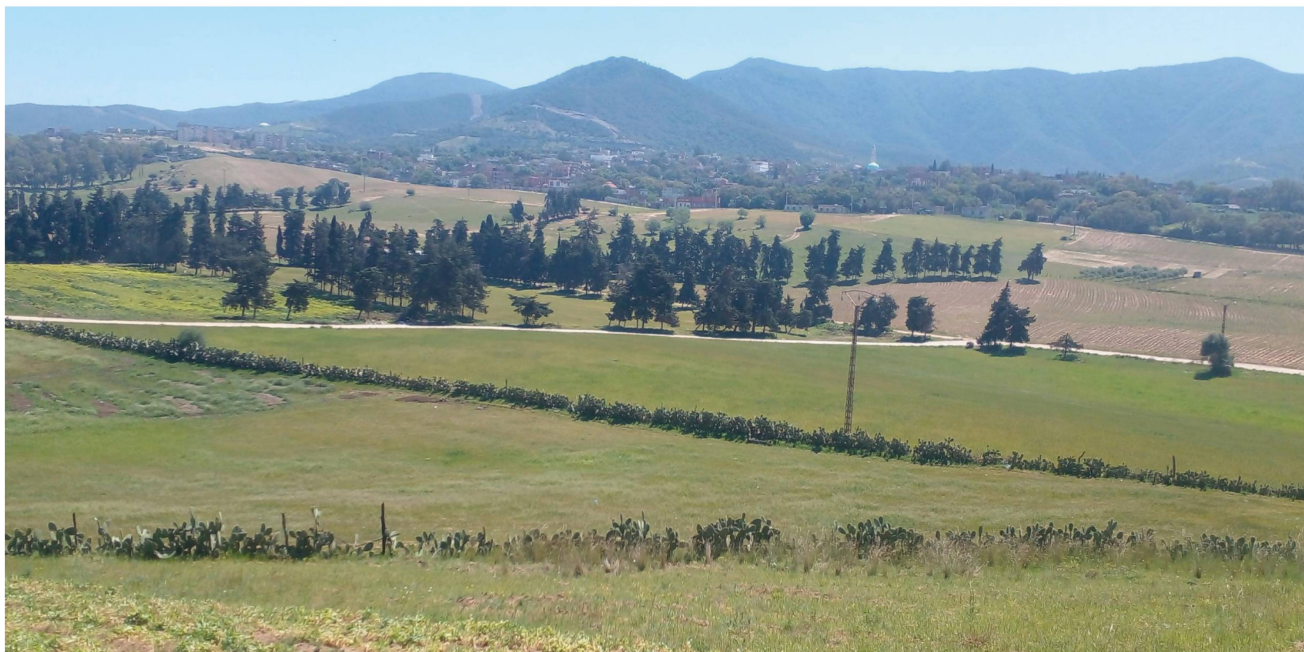
Figure 3. Habitat de Silene colorata subsp. amphorina dans l'arrière-dune littorale avoisinant le Djebel Filfilla (Cité Larbi Ben M'hidi, Skikda, Nord-Est algérien).