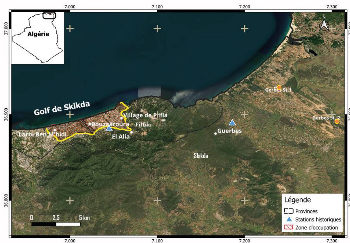
Figure 4. Aire de distribution de Silene colorata subsp. amphorina et nouvelles stations découvertes à l'ouest du Djebel Filfilla et dans le complexe dunaire de Guerbès-Sanhadja (Skikda, Nord-Est algérien).