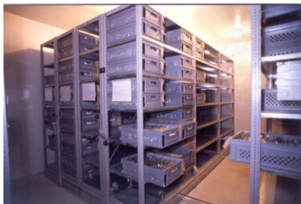
La banque de gènes

Vous vous rendez compte des problèmes qui peuvent surgir lors de la multiplication.