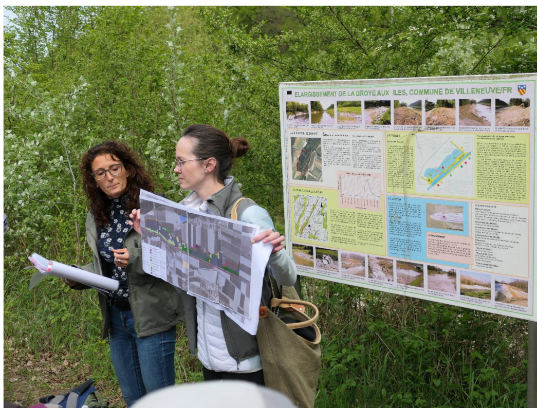
Emilie Tridondane et Audrey Friedly © SVSN.

Lors de cette journée, nous vous guiderons sur plusieurs secteurs restaurés de la Basse Broye, à la découverte de la faune et la flore fluviale.