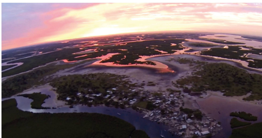
Village de Ngadior au Sénégal © Valérie D'Acremont.

Le dérèglement climatique a de plus en plus d'impact direct et indirect (via la perte de biodiversité et la pollution) sur la santé de la population et sur le secteur des soins. Connaître les impacts de ces aléas climatiques permet d'essayer de les prévenir autant que possible, en transformant notre système de santé en profondeur, pour le rendre plus durable et robuste.