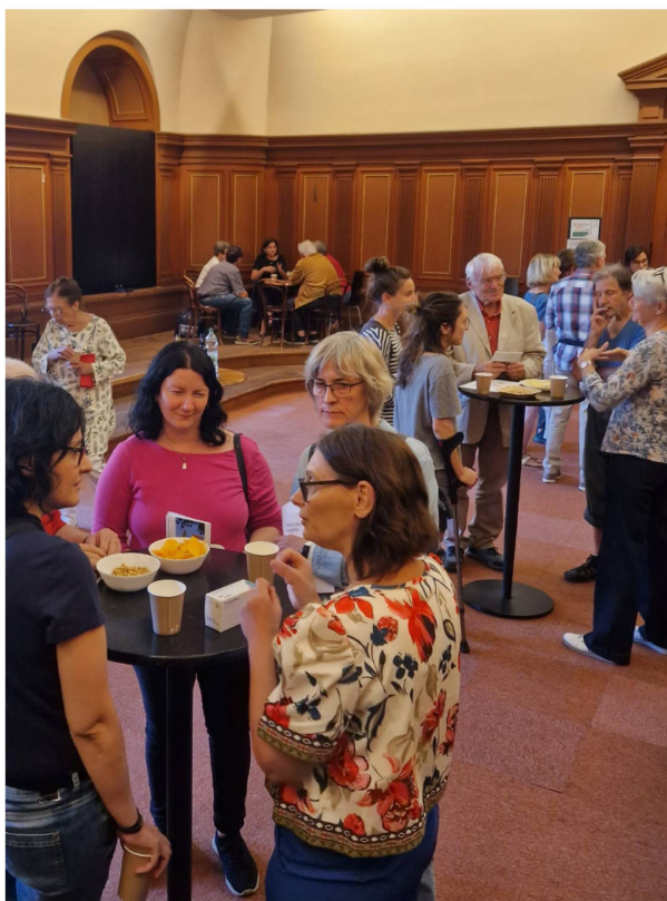
Speed dating - ambiance © SVSN.

Alors, comment notre corps fait-il la distinction entre un microbiome sain et des agents pathogènes dangereux? En quoi les cellules normales, qui doivent être protégées, sont-elles différentes des cellules cancéreuses, qui devraient être rapidement éliminées? Lors de ce Speed Dating Scientifique, nous invitons six chercheurs·euses en lien avec l'Université de Lausanne, toutes spécialistes d'un des aspects de cet équilibre délicat. Nous nous réjouissons de vous accueillir à cette soirée interactive, où vous pourrez découvrir les avancées scientifiques actuelles dans les domaines de la microbiologie, de l'immunologie et des maladies infectieuses sous diverses perspectives, allant de la recherche fondamentale à la recherche clinique et appliquée jusqu'à la réalisation des nouveaux traitements et les implications pour la société.