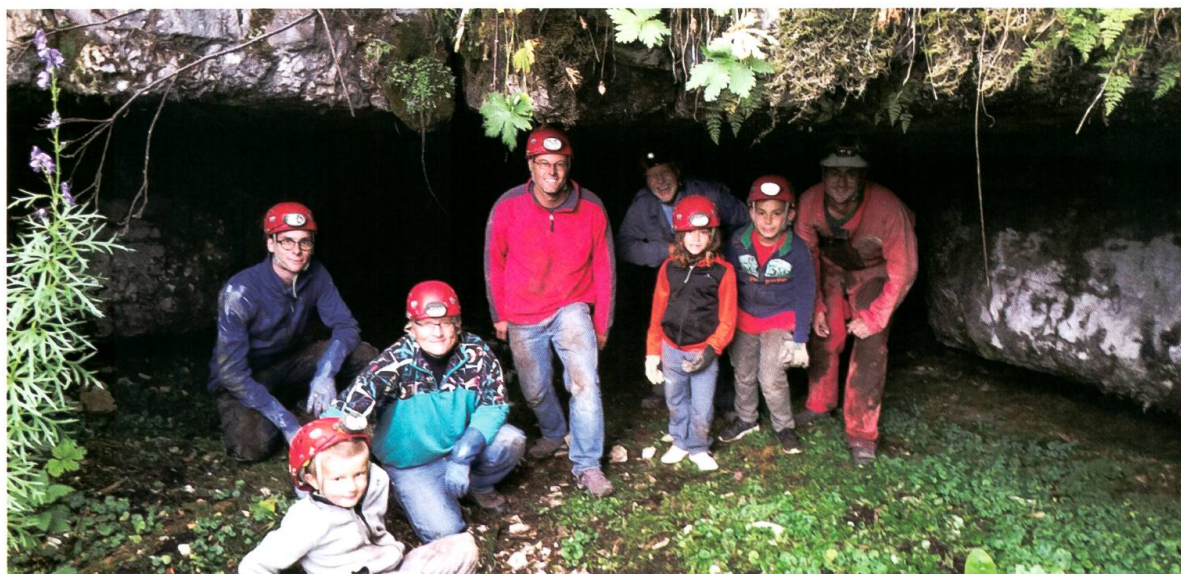
Initiation à la spéléologie et sensibilisation à la protection des gouffres karstiques dans le secteur des Amburnex.

Activité en partenariat avec ASTROVAL, Association d'astronomie de la Vallée de Joux, grâce à qui vous pourrez profiter d'instruments d'observation à disposition.