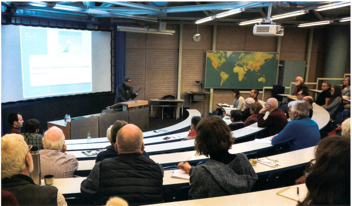
Conférence du Prof. Francesco Panese à l'occasion du symposium du 16 février.