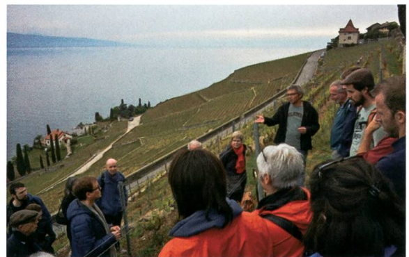
Excursion du 18 mai sur le domaine du Burignon.

Samedis 27 avril, 29 juin et 5 octobre 2019 - Visites guidées en collaboration avec les communes de Bex, Mies et Lignerolle.