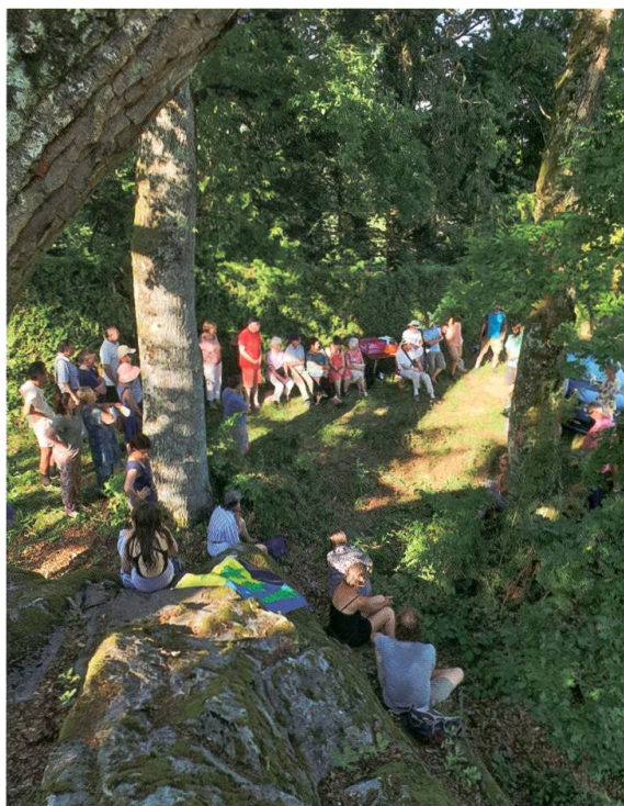
La Pierre à Pény à Mies le 29 juin.