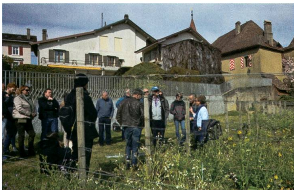
Excursion du 6 avril sur le domaine du Château Rochefort.