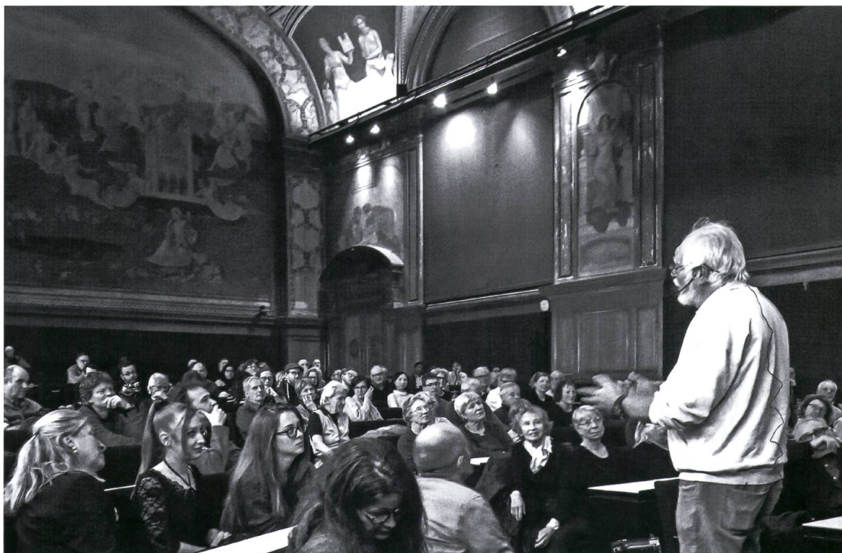
Le prof. Jacques Dubochet, prix Nobel de chimie 2017, lors de sa conférence du 13 mars en marge de l'assemblée générale de la SVSN.

Le choc qui vient avec le prix, c'est la voix. Tout à coup, on vous écoute – ça, oui – et on vous croit supérieur – ça, non. Mon premier grand exercice, je l'ai fait à Stockholm le 8 décembre 2017. Depuis, je continue d'y travailler. D'une manière ou d'une autre, il porte sur la connaissance, ce bien commun qu'il faut défendre pour le bénéfice de tous.