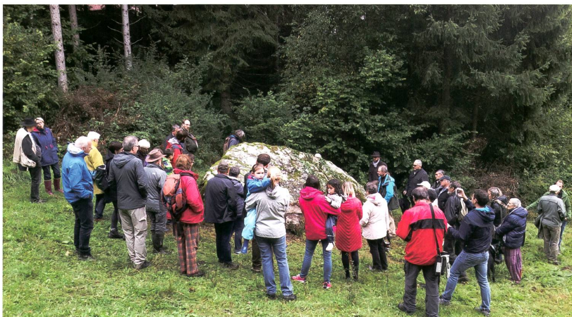
La Pierre Bleue à Lignerolle le 5 octobre.