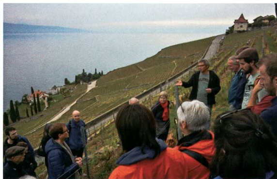
Excursion du 18 mai sur le domaine du Burignon.

Samedis 27 avril, 29 juin et 5 octobre 2019 - Visites guidées en collaboration avec les communes de Bex, Mies et Lignerolle.