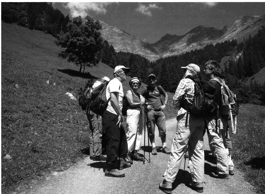
La discussion s'engage autour de la formation des Préalpes médianes et du lien entre la géologie et les milieux naturels.