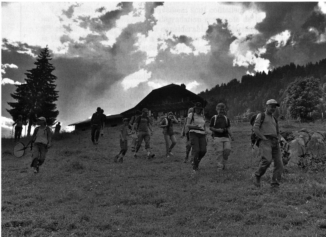
Descente vers l'abri sous roche.