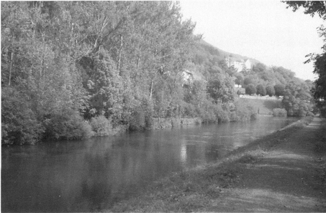
Figure 6.—La ripisylve humide et marécageuse de l'Orbe à Vallorbe abrite une population de Neomys fodiens (M. Blant).