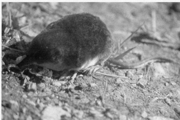
Figure 4.—Une musaraigne aquatique ( Neomys fodiens ) capturée à Sainte-Croix (M. Blant).

Le lérot ( Eliomys quercinus ) a été capturé en nombre important sur deux sites du Parc jurassien vaudois: un bâtiment (Chalet à Roch Dessous, 1380 m) et un lapiez d'altitude (Chalet à Roch Dessus, 1460 m). Ces sites correspondent bien à son penchant rupicole (CATZEFLIS 1995), qui l'oriente vers les zones rocailleuses et les habitations.