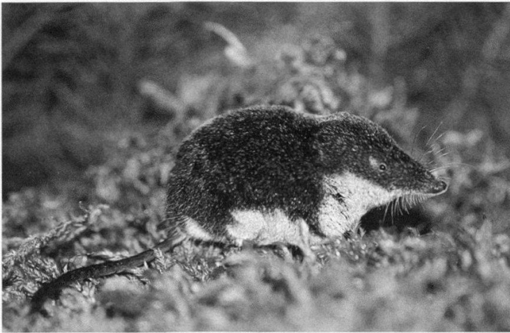
Figure 3.—La musaraigne de Miller ( Neomys anomalus ), espèce pour l'instant non confirmée dans le Jura (P. Marchesi).

dans les grandes zones marécageuses des tourbières de Frasne à plus de 800 m (MICHELAT et al. 2005) semble indiquer qu'elle peut monter en altitude dans le Jura également. La grandeur des milieux humides, souvent très restreints du côté suisse, pourrait être un facteur limitant.