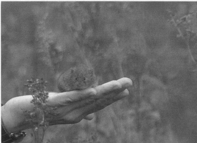
Figure 8.—Le campagnol agreste ( Microtus agrestis ), un hôte récurrent des milieux humides (M. Blant).

Le nombre élevé de campagnols agrestes ( Microtus agrestis ) (fig. 8) par rapport au nombre de campagnols des champs ( Microtus arvalis ) dans nos piégeages dénote le choix éclectique des sites de piégeage envers les zones de marais. Le campagnol agreste fréquente volontiers ces milieux, ainsi que les talus, friches, haies et lisières, laissant les prairies et pâturages plus intensifs des milieux ouverts au campagnol des champs (MEYLAN 1995).