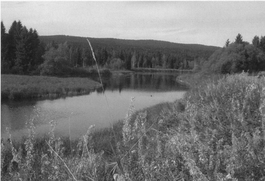
Figure 7.—Les rives marécageuses de l'Orbe dans la Vallée de Joux, un biotope typique à Neomys fodiens (M. Blant)