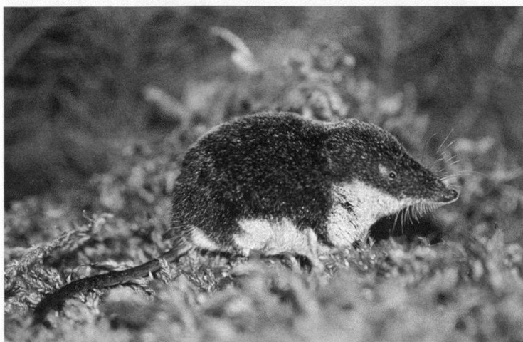
Figure 3.—La musaraigne de Miller ( Neomys anomalus ), espèce pour l'instant non confirmée dans le Jura (P. Marchesi).

dans les grandes zones marécageuses des tourbières de Frasnè à plus de 800 m (MICHELAT et al. 2005) semble indiquer qu'elle peut monter en altitude dans le Jura également. La grandeur des milieux humides, souvent très restreints du côté suisse, pourrait être un facteur limitant.