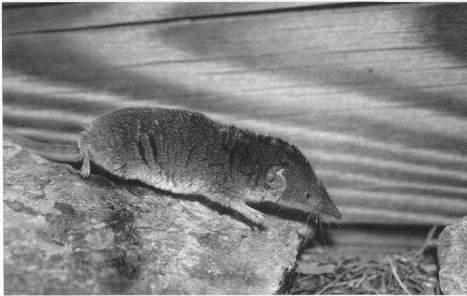
Figure 2.–La musaraigne carrelet ( Sorex araneus ) (P. Marchesi).

suisse sont Dornach (U. Rahm – 1916), Bassins (P. Vogel – 1977) et Begnins-Trélex (A. Meylan – 1980) (données CSCF).