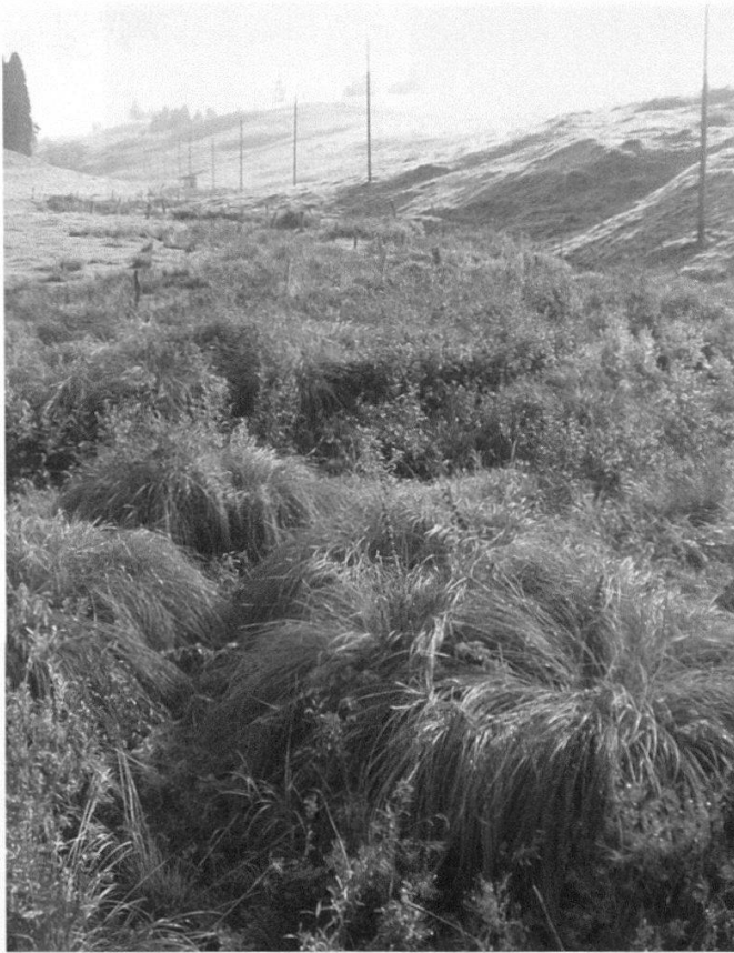
Figure 5.—Des milieux humides restreints abritent Neomys fodiens dans la région de Sainte-Croix : la source de la Noiraigue (M. Blant).