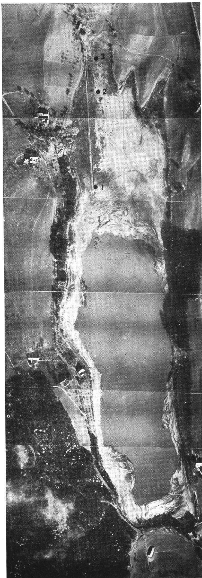
FIG. 1. Le lac de Bret pendant les basses eaux de 1947.

20 nov. 1947.