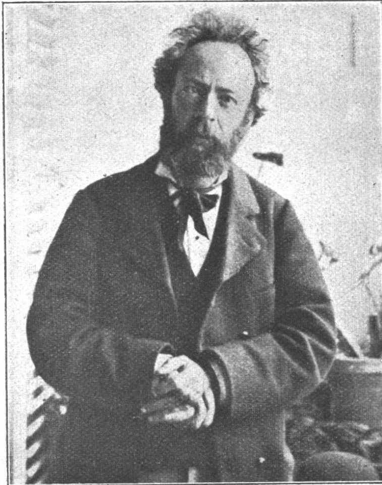
Phot. de feu le prof. Chastellain, 1884

G. du Plessis donnait sa démission à la fin du semestre d'été 1885 pour des raisons d'ordre intime. Pendant l'exercice de ses fonctions, il a pu jouir de plusieurs congés qui lui furent accordés, le premier, pendant le semestre d'hiver de 1875-1876, qu'il passa à l'Université