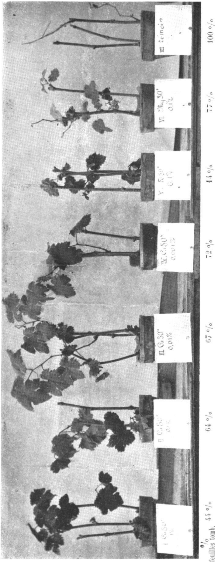
FIG. 2. — Culture de sarments en tourbe. (Photographie prise au moment de la chute des feuilles.)