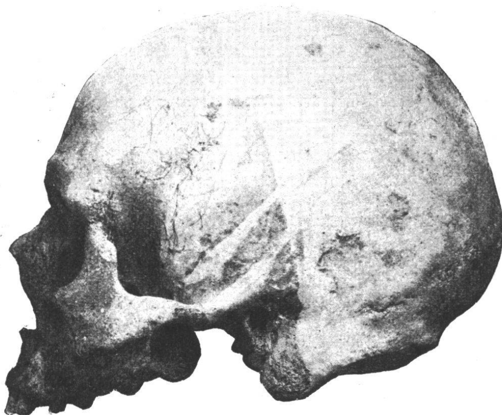
Fig. 36. — Crâne masculin n° 26. Norma lateralis .

La courbe sagittale et occipitale ne forme pas de saillie très appréciable de la région postérieure du crâne. Les lignes courbes occipitales supérieure et inférieure sont extraordinairement puissantes ; les apophyses mastoïdes sont volumineuses. Il y a un prognathisme assez marqué de la région sous-nasale (indice de 100.97). Le ptérion est en H.