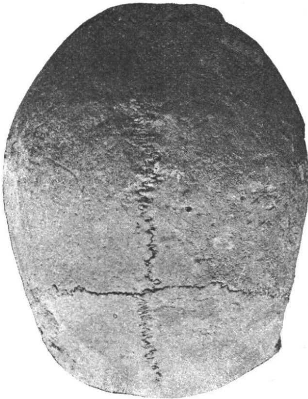
Fig. 18. — Crâne masculin n° 3. Norma verticalis.

ment visible sur le côté droit du crâne, grâce au fort développement transversal de sa région antérieure. Les bosses pariétales sont faiblement marquées.