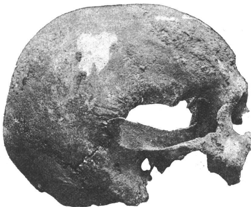
Fig. 17. — Crâne masculin n° 3. Norma lateralis .

condylien. Les apophyses mastoïdes sont bien développées.