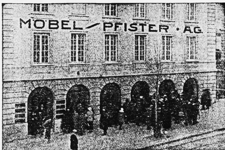
Unser Bild zeigt, wie die Leute auf Einfluss warten an einem öffentlichen Besuchstag in unserem Berner Haus. An solchen Tagen werden unsere Ausstellungen oft von Tausenden besichtigt.

Die gediegenen Wohnkunst-Ausstellungen der Möbel-Pfister A.-G. in Basel, Bern und Zürich zeigen in vorbildlicher Weise, was aus vier einfachen Wänden gemacht werden kann, wenn guter Geschmack und fachmännische Kenntnisse Hand in Hand arbeiten. Mit wenig Mitteln ist hier viel Schönes und Gutes erreicht worden. Dabei ist unserem schweizerischen Sinn für wohnliche Behaglichkeit in besonderer Weise Rechnung getragen. 200 muster-gültige Wohnräume bester Qualität und Form geben dem Besucher die notwendigen Anregungen zur wohnlichen Ausgestaltung seines Heims. Entsprechend der Grösse ist auch die überraschende Leistungsfähigkeit der Firma in der Preisfrage.