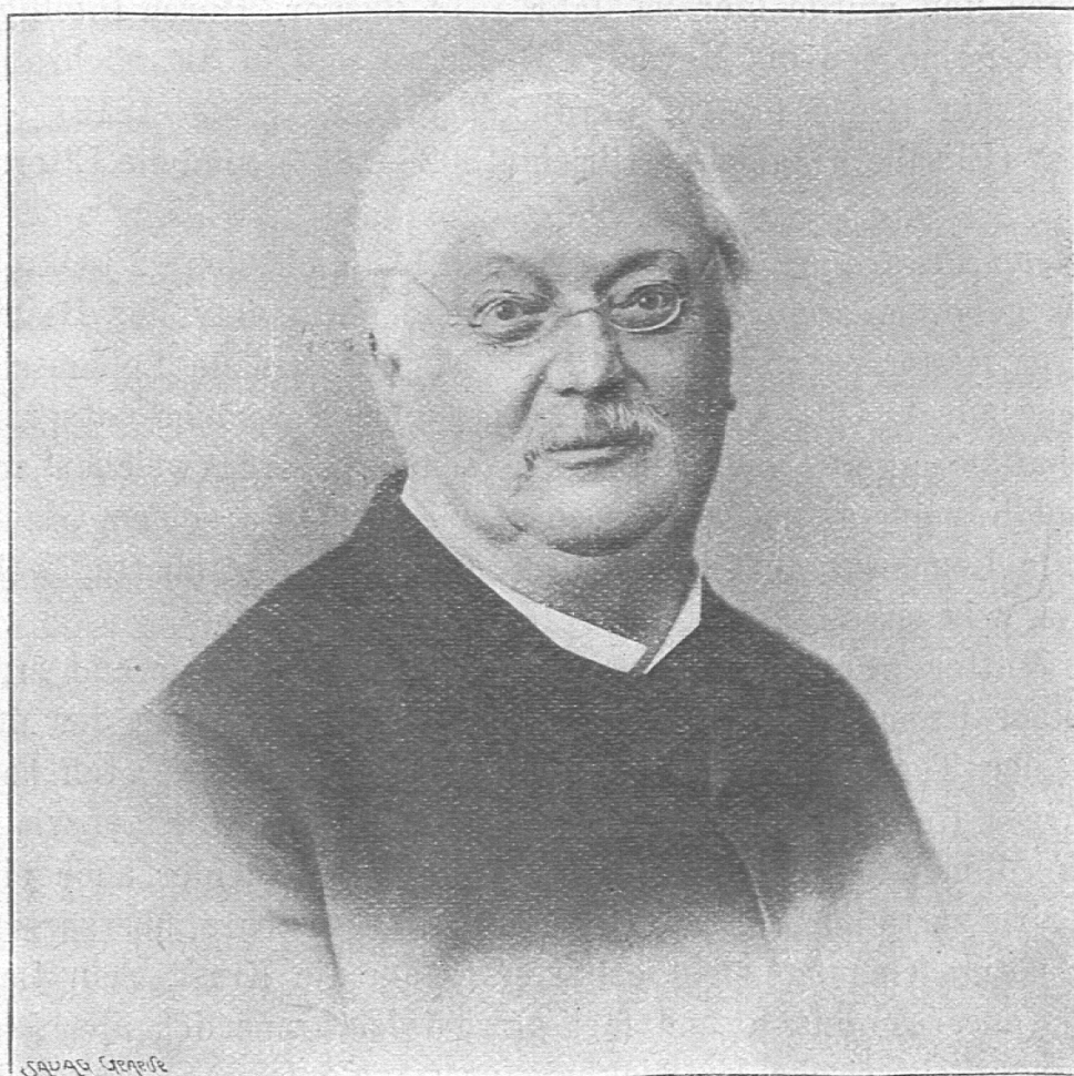
Conrad Ferdinand Meyer.