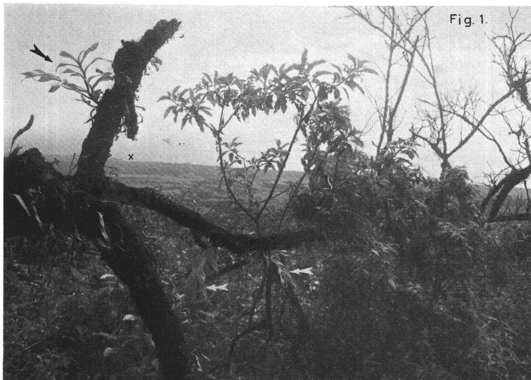
Fig. 1. Ile Fernandina. Epidendrum spicatum épiphyte sur Tournefortia sp. Au fond, marqué d'une croix, le Cabo Hammond. Altitude 530 m. Le 4 février 1970.