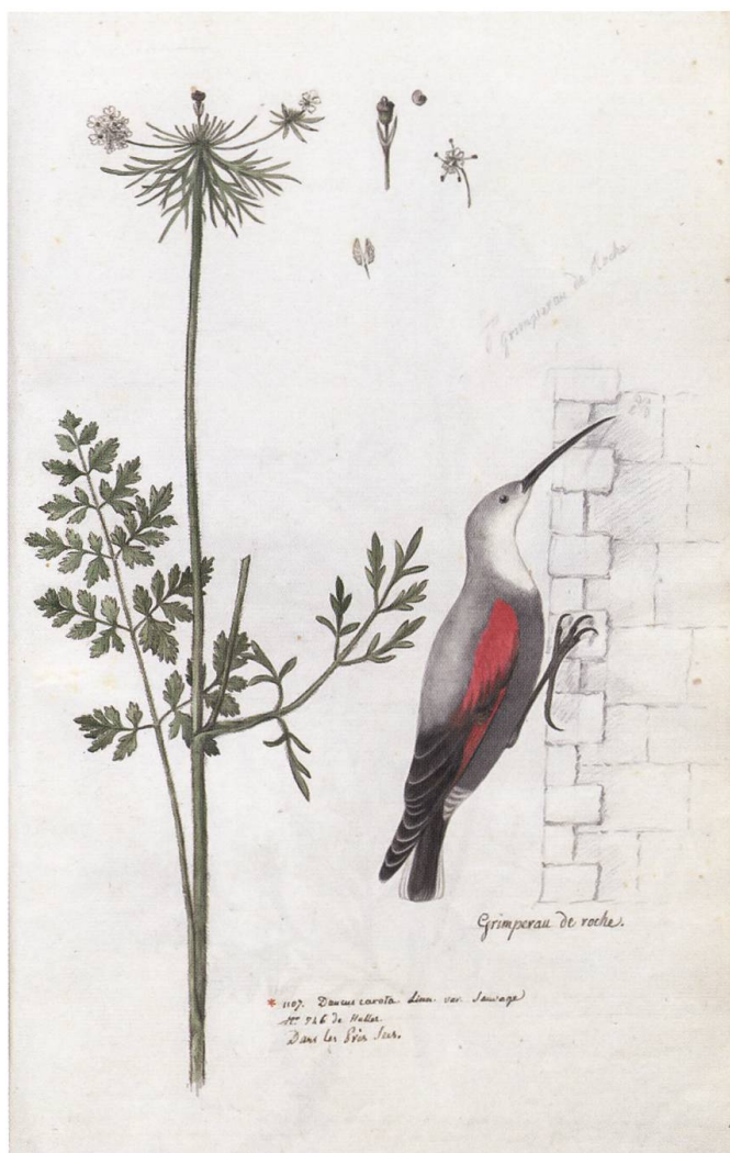
Tichodrome échelette ( Grimpereau de roche ) par Louis Benoît

fournissant aucun oiseau aquatique nous en sommes fort peu fournis, et des Exotiques encore moins. Je joins à la Grive un petit oiseau gris et rouge qui à l'air d'un Espece de Merops par son bec en faucille qu'on appelle dans le Haut Dauphiné où j'en ai vû beaucoup sur les Rochers du Montdauphin, l'appellant Pic de Muraille il s'en trouve quelques uns dans nos Environs, surtout aux Rochers qui bordent le Doux, et aux Murailles des maisons de la Neuveville dans le Vignoble où ils attrapent sans doute des Mouches. Vous me feriez plaisir Monsieur de m'en apprendre