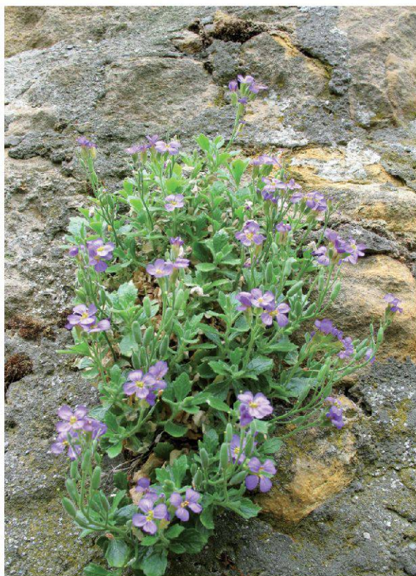
Figure 3 : Aubrieta deltoïdea (L.) DC. (Brassicacée).