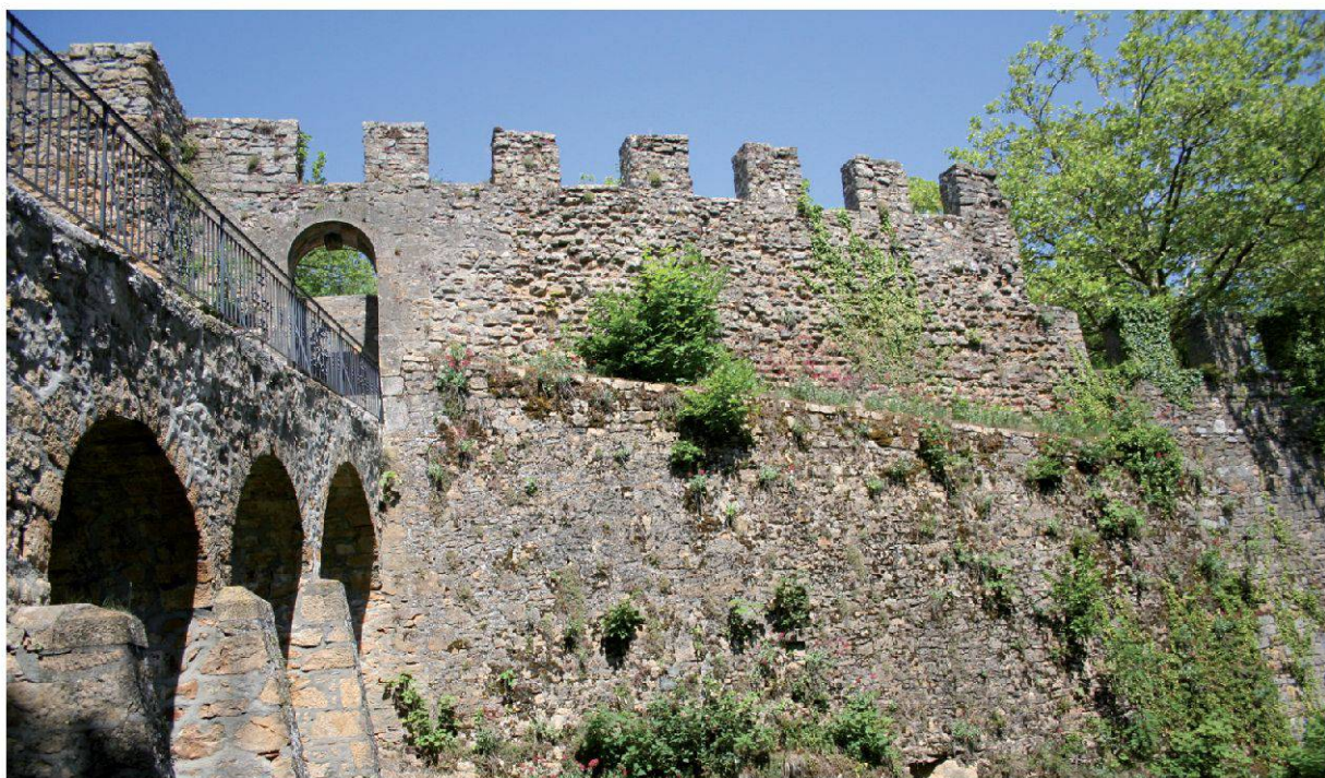
Figure 1 : Mur d'enceinte de l'esplanade du château de Neuchâtel. La partie étudiée est le grand rectangle mural au centre de l'image.