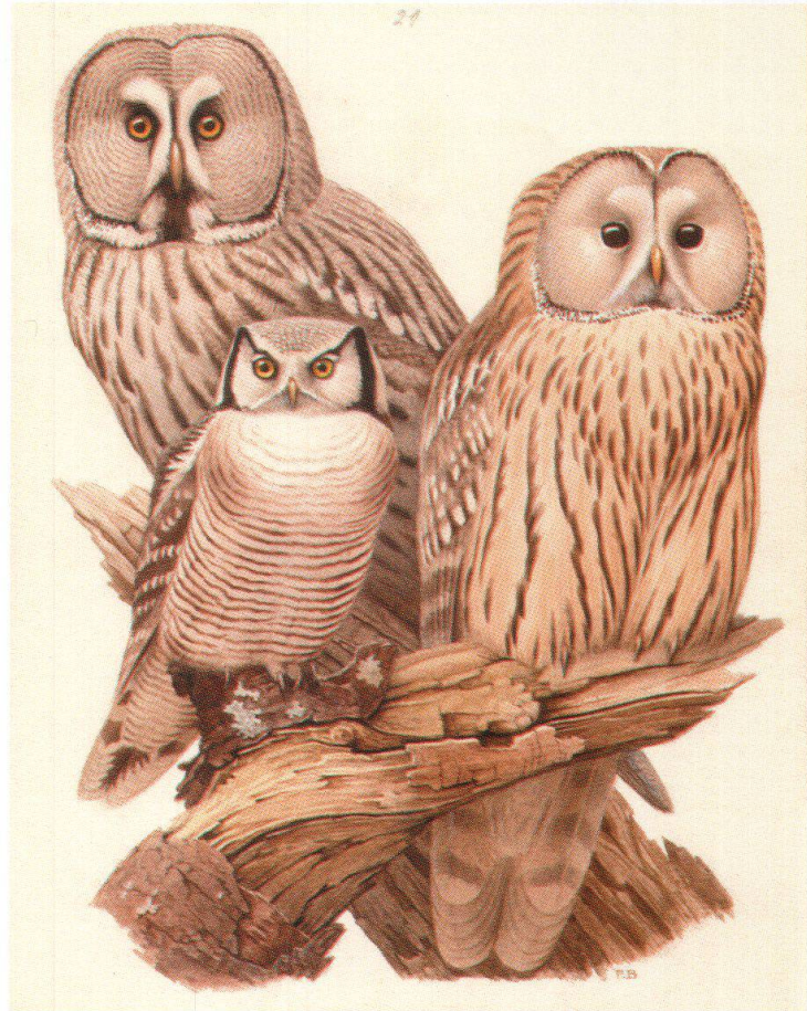
Planche 1 :

A. Aquarelle originale de Paul Barruel pour les Editions Silva. Fonds Paul Barruel, Musée d'histoire naturelle, La Chaux-de-Fonds