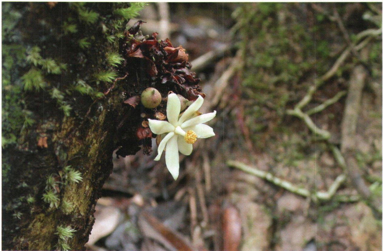
Figure 5: Mammea mirabilis Stevens INED (sp. nov.) (SW516, SW548). Arbre de 7 m, dioïque (ici mâle), cauliflore, observé uniquement durant la première partie du transect, le long des cours d'eaux à basse altitude.

seuls subsistent quelques îlots parsemés le long de la côte orientale. Le parc détaché d'Andranoala (PD1) abrite une magnifique forêt littorale sur sable. Cette formation possède un grand nombre de taxons typiques qui deviennent de plus en plus rares lorsqu'on s'éloigne de la côte. Citons Chrysalidocarpus lutescens (Arecaceae), Casuarina equisetifolia (Casuarinaceae), Brexia madagascariensis (SW475) (Celastraceae), Terminalia catappa (Combretaceae), Cycas thouarsii (Cycadaceae), Dracaena reflexa , D. angustifolia (Dracaenaceae), Barringtonia asiatica , B. racemosa (Lecythidaceae), Heritiera littoralis (Malvaceae), Pandanus concretus subsp. circularis (SW692), Martellidendron karaka (SW477, SW696) (Pandananaceae), Macphersonia cauliflora (SW487) (Sapindaceae), Leptolaena multiflora (SW679), Sarcolaena multiflora (SW677) et Xyloolaena richardii (SW495)