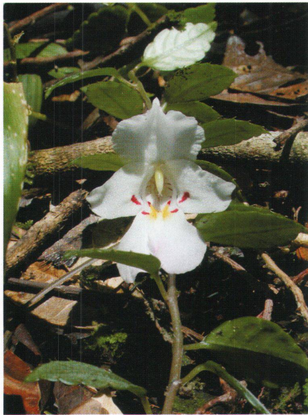
Figure 4: Impatiens gr. manaharensis (SW662). Impatiens épiphyte poussant sur Canarium mada-gascariensis dans les forêts de crêtes à 750 m.

La cauliflorie (inflorescences directement insérées sur le tronc ou les rameaux) est une autre caractéristique biologique propre aux forêts tropicales. ENDRESS (1996) souligne qu'une grande partie des espèces cauliflores sont pollinisées ou disséminées par les chauves-souris. La cauliflorie se retrouve à la fois chez des espèces arborescentes, arbustives et lianescentes. Citons quelques exemples que nous avons rencontrés lors du transect: espèces arbustives ou arborescentes: Vitex aff. cauliflora (SW661), Clerodendrum (SW500) (Verbenaceae); Mammea sp. nov. (SW516, SW548) (Clusiaceae) (fig. 5), Tambourissa (SW593, SW689) (Monimiaceae), Rhodocolea aff. involuta (SW682) (Bignoniaceae), Drypetes aff. thouarsiana (SW505) (Euphor-