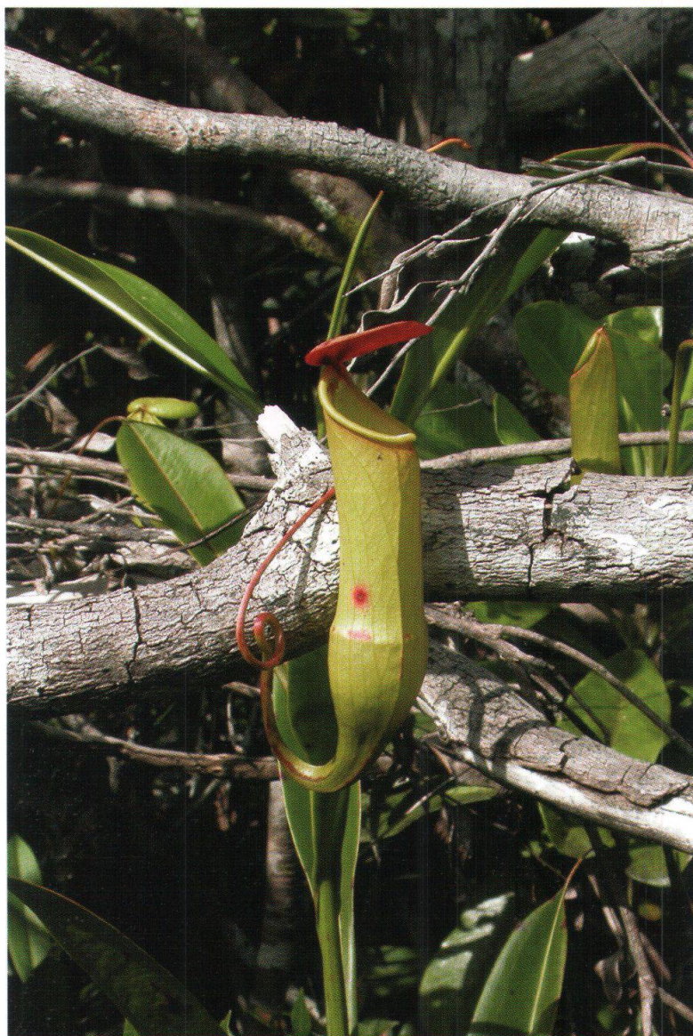
Figure 6: Urne de Nepenthes masoalensis Schmid-Hollinger. Plante carnivore endémique de la péninsule de Masoala, colonisant les marais herbacés du PD1 Andranoala.

Les mangroves constituent une variante édaphique des forêts denses humides qui colonisent les rivages marins intertropicaux dont les eaux saumâtres sont assez chaudes. Comme nous avons pu le mettre en évidence ci-dessus, leur distribution dépend principalement des courants marins qui baignent les côtes. Les espèces qui peuplent cette formation doivent posséder une grande capacité d'adaptation à des conditions mésologiques extrêmes: haut taux de salinité, instabilité du substrat et asphyxie. Afin de répondre à l'instabilité du substrat et à l'asphyxie, les espèces ont développé des racines échasses ainsi que des pneumatophores. Un moyen