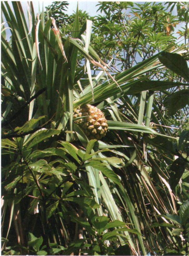
Figure 3: Infrutescence de Pandanus insuetus Huynh (SW470), appartenant à la section Mammilliarisia , endémique de la péninsule de Masoala. Cette espèce rare pousse le long des cours d'eaux à basse altitude, comme ici dans la région de Vinanivao.

La cauliflorie (inflorescences directement insérées sur le tronc ou les rameaux) est une autre caractéristique biologique propre aux forêts tropicales. ENDRESS (1996) souligne qu'une grande partie des espèces cauliflores sont pollinisées ou disséminées par les chauves-souris. La cauliflorie se retrouve à la fois chez des espèces arborescentes, arbustives et lianescentes. Citons quelques exemples que nous avons rencontrés lors du transect: espèces arbustives ou arborescentes: Vitex aff. cauliflora (SW661), Clerodendrum (SW500) (Verbenaceae); Mammea sp. nov. (SW516, SW548) (Clusiaceae) (fig. 5), Tambourissa (SW593, SW689) (Monimiaceae), Rhodocolea aff. involuta (SW682) (Bignoniaceae), Drypetes aff. thouarsiana (SW505) (Euphor-